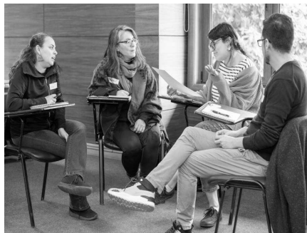
Jornada permitió a funcionarias y funcionarios de distintas unidades de la comunidad universitaria profundizar sobre los procesos de internacionalización implementados por la casa de estudios, en el marco de la Estrategia de Internacionalización 2023-2030.

En el marco de la programación de la II Semana Internacional UFRO: Internacionalización para todas y todos, la Coordinación de Movilidad Estudiantil (Vicerrectoría Académica) desarrolló el curso Cambio Universitario Sistémico Hacia la Internacionalización ( SUCTI ) por su sigla en inglés (Systemic University Change Towards Internationalisation). La jornada nace como un espacio para medir y acercar el nivel de conocimiento de los estamentos de la Universidad de La Frontera sobre la internacionalización, a la vez que permitió profundizar sobre la misma y dialogar en cuanto a expectativas de las y los participantes.